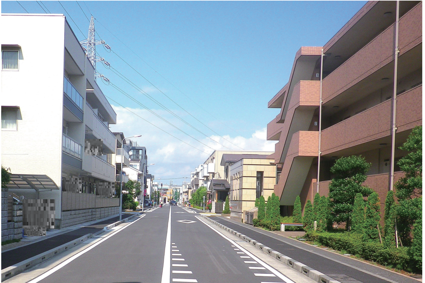
瑞江駅西部地区（令和元年7月撮影）